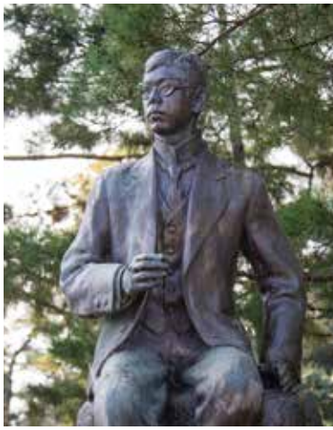
瀧廉太郎のご先祖さまは、日出藩の家老をつとめた家柄。