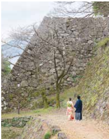
およそ400年前の当時の石垣(穴太積み)に往時をしのぶ。