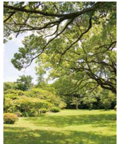
かつて金山王の邸宅だった優美な「的荘」の庭園は必見。(10時~16時入園無料)