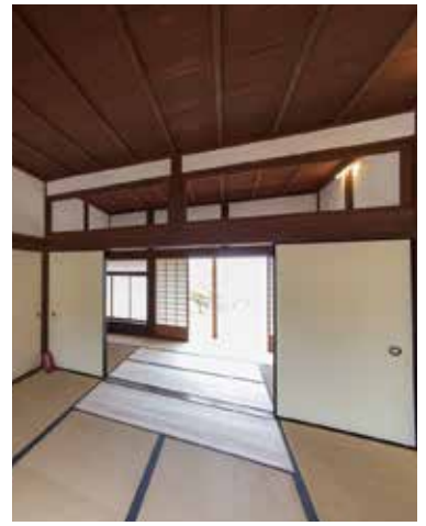
県内で唯一現存する藩校「致道館」からの景色も素晴らしい(月曜休館)。