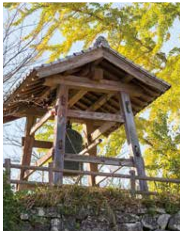
今も小学校の児童達が鐘を突く「元禄の時鐘」は300年以上前に造られたもの。