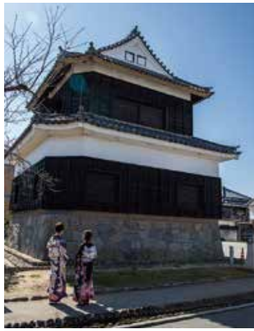
歴史に詳しいスタッフがご案内する「鬼門櫓」(月曜休館)。