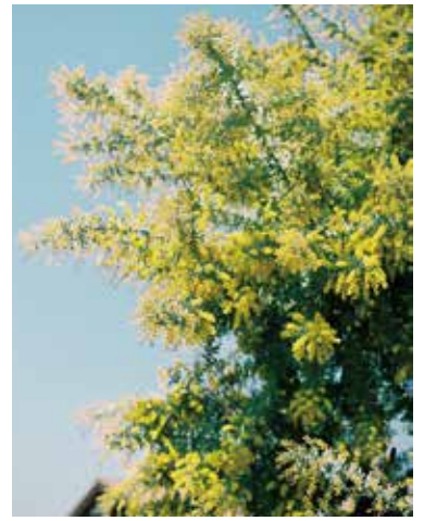
黄色の菜の花やミモザが春の訪れを告げる(1月~3月)。