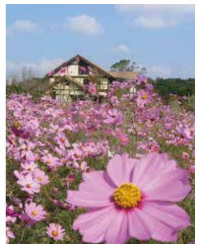
コスモスが揺れ秋から冬の準備を迎える(10月)。