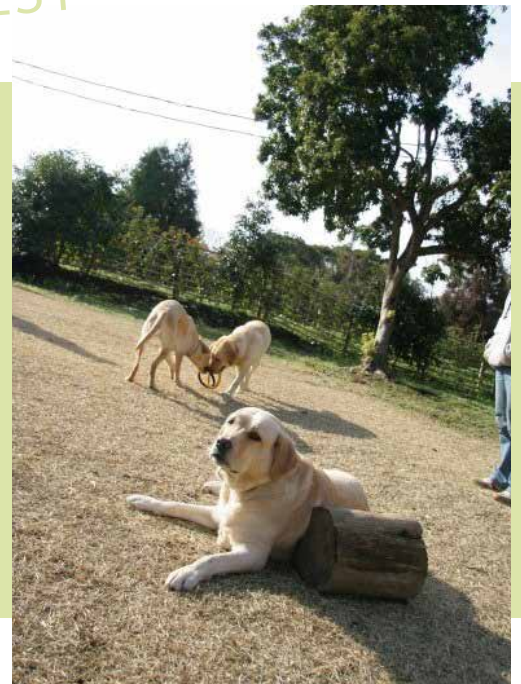
1500㎡のドックランエリア(1頭につき500円)

別府湾を一望する海岸線と美しい森に包まれている「大神ファーム」は、やすらぎに満ちた空間を演出しております。自然と調和しながら、心豊かに暮らすスローライフを提案します。