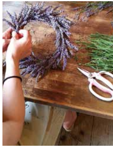
リースやクラフト体験、アロマキャンドルづくりなどが楽しめる工房。