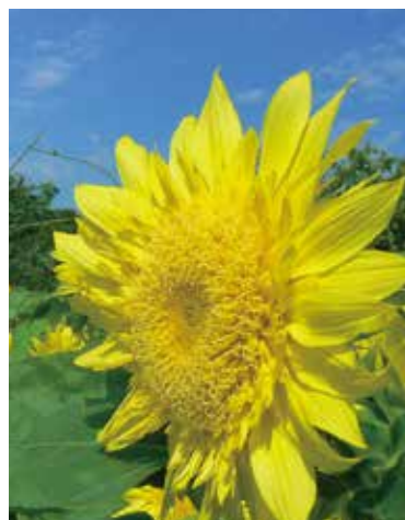
黄色のひまわり畑で夏満喫(7月~8月)。