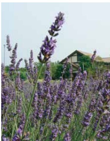
紫色のラベンダー畑が優しくそよぐ(6月)。