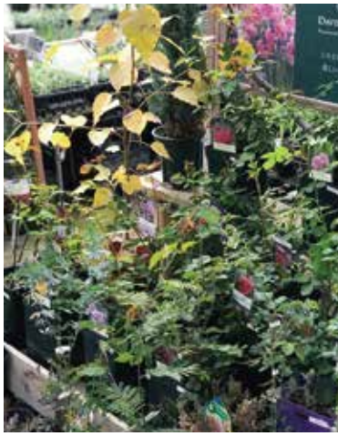
苗市場。バラ・ハーブなどを中心に果樹などの直売所。